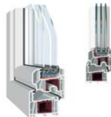
KÄUFERLE AD-HFV Flügel halbflächenversetzt, 3-fach-Verglasung