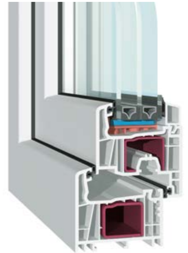
KÄUFERLE AD-FV Flügel flächenversetzt, 3-fach-Verglasung