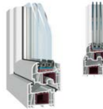
KÄUFERLE AD-RF Rundflügel, 3-fach-Verglasung

Zu schön, um wahr zu sein. Harmonische Schrägen und gerundete Kanten bestimmen die Optik unserer Qualitätsfenster. Die Bautiefe von 76 mm ist beste Voraussetzung für eine überzeugende Schall- und Wärmedämmung. Bei Käuferle-AD haben Sie die Wahl zwischen den drei Ausführungen flächenversetzt, halbflächenversetzt oder mit Rundflügel. Wählen Sie darüber hinaus optional verbesserte Eigenschaften für einen optimalen Einbruchschutz.