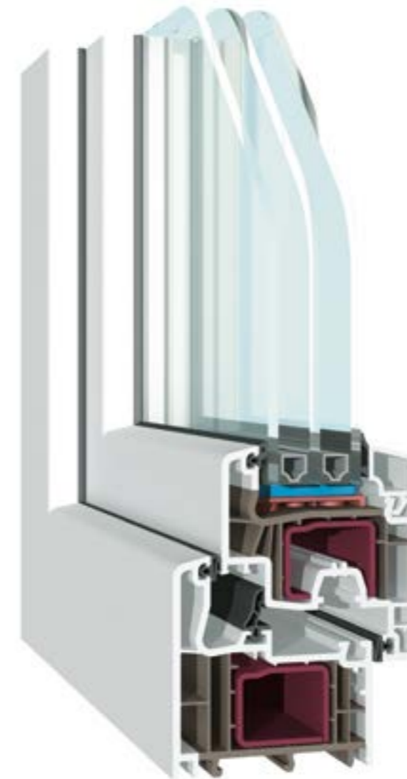
KÄUFERLE MD-FV Flügel flächenversetzt, 3-fach-Verglasung

Das Geheimnis der Fenster-Generation MD ist ihre dritte Dichtungsebene. Der damit verbundene bessere Schallschutz und die optimierte Wärmedämmung sparen nicht nur Nerven, sondern auch jährliche Energiekosten. Mit Gläsern des ACSplus-Randverbundes schonen Sie dabei nicht nur die Umwelt, sondern auch den Geldbeutel. Sie wünschen ein Plus an Sicherheit? Dann wählen Sie unseren optional verstärkten Einbruchschutz.