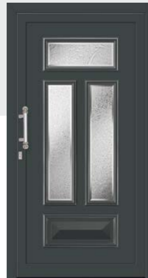
F18 PARIS 3 Felder verglast, integrierter Sondergriff

Werte nicht für Hebeschiebetür-Anlagen verwendbar.