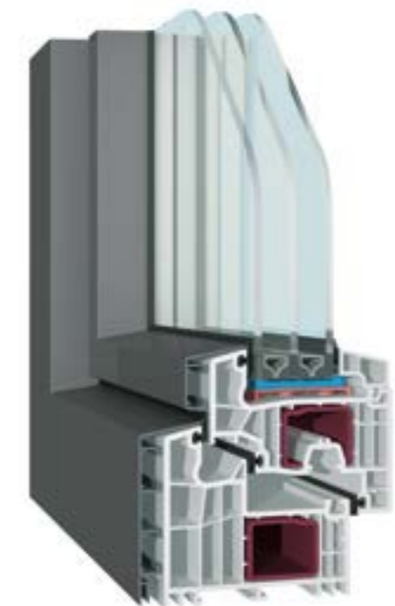
KÄUFERLE BLUEEVOLUTION-HFV/ALU Rahmen und Flügel halbflächenversetzt, Ansichtsbreite 118 mm, Alu-Vorsatzschalen