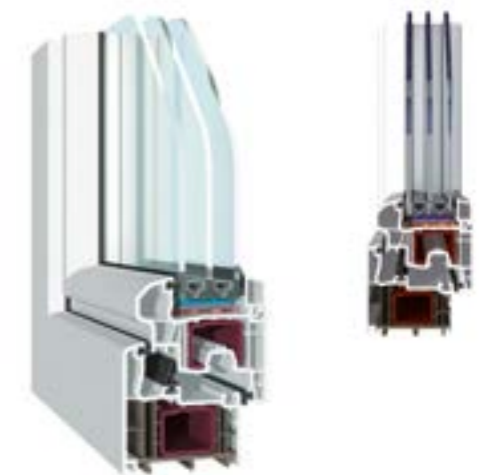
KÄUFERLE MD-HFV Flügel halbflächenversetzt, 3-fach-Verglasung