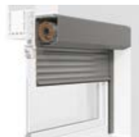
VORBAU-ROLLLADEN Pento. XP