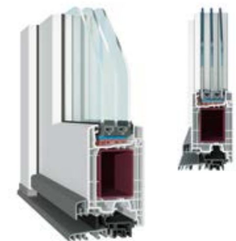
KÄUFERLE-KUNSTSTOFF-HAUSTÜR AD-Haustürsystem, 76 mm Bautiefe