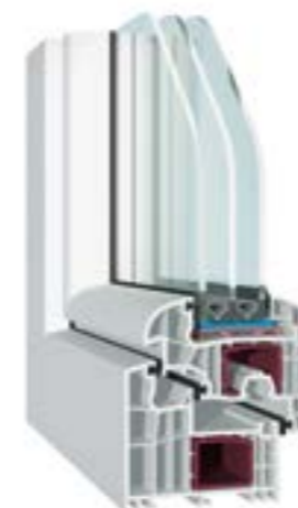
KÄUFERLE BLUEEVOLUTION-HFV Flügel halbflächenversetzt, 3-fach-Verglasung