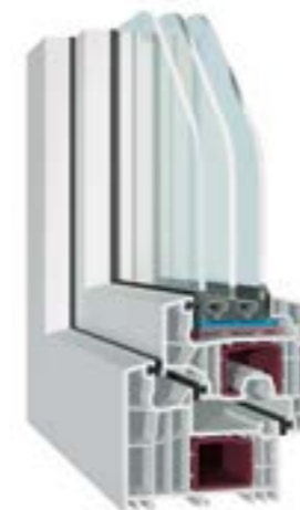
KÄUFERLE BLUEEVOLUTION-FV Flügel flächenversetzt, Ansichtsbreite 118 mm

Unser First-Class-Fenster „blueEvolution“ kann mit Aluminium-Vorsatzschalen als Plus ausgestattet werden. Diese können mit jedem RAL-Ton lackiert, pulverbeschichtet oder eloxiert werden und geben Ihnen somit noch viel mehr Möglichkeiten, den Charakter Ihrer Fassade individuell zu beeinflussen.